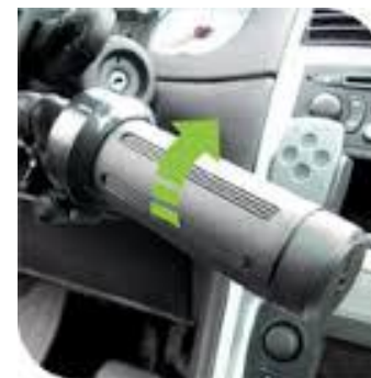
Accélération par poignée rotative et frein à pousser