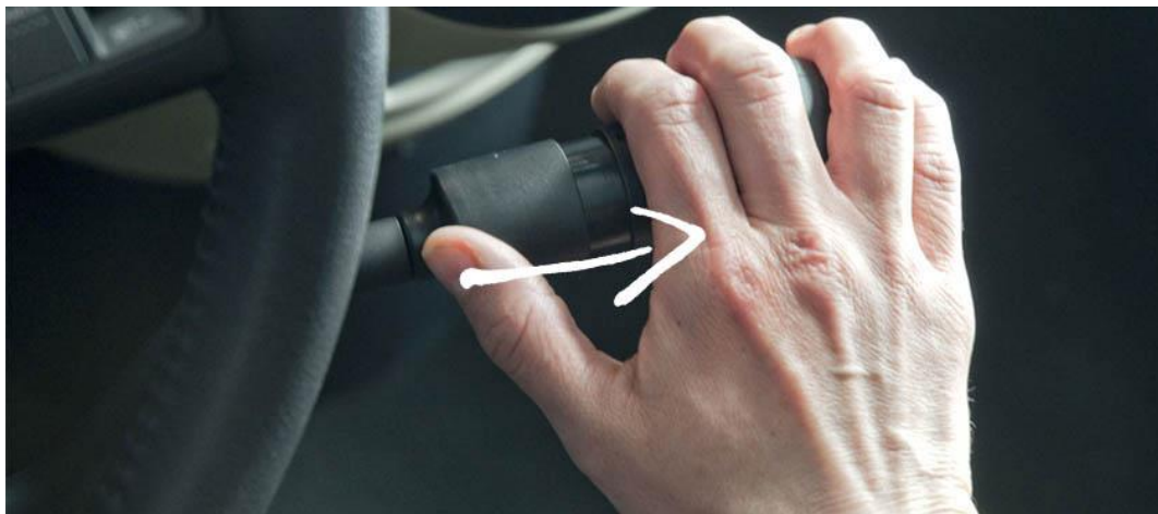
Accélérateur à gâchette et frein à pousser